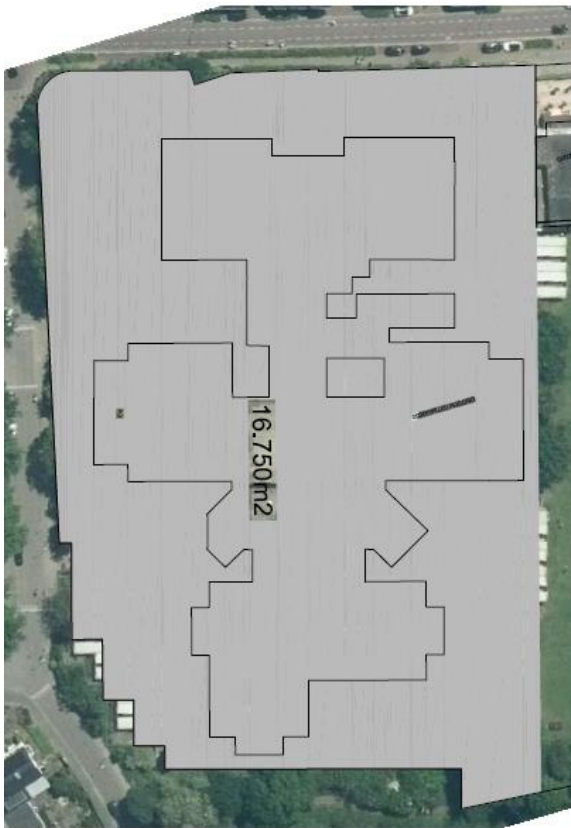
Figuur 1 Huidige situatie Sleutelbosch